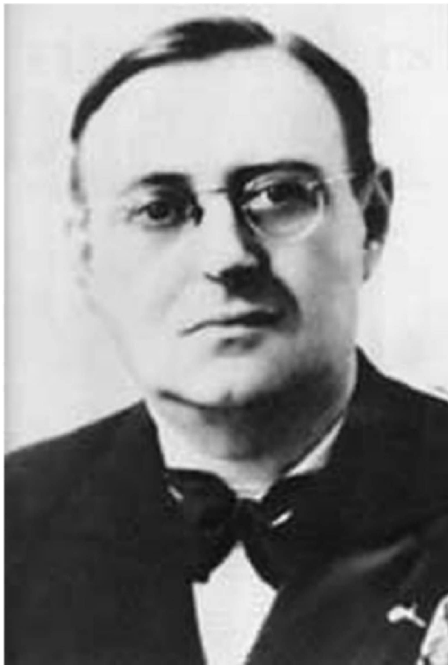
Figura 10: Apenas mais um gravatinha?