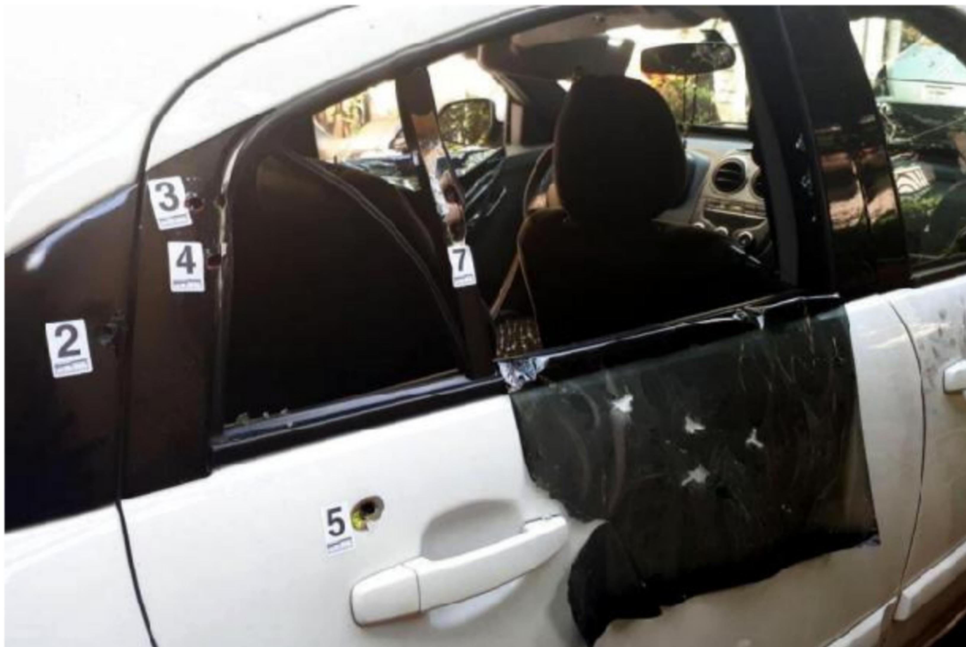
Figura 5: Marielle: morte sem ameaças prévias