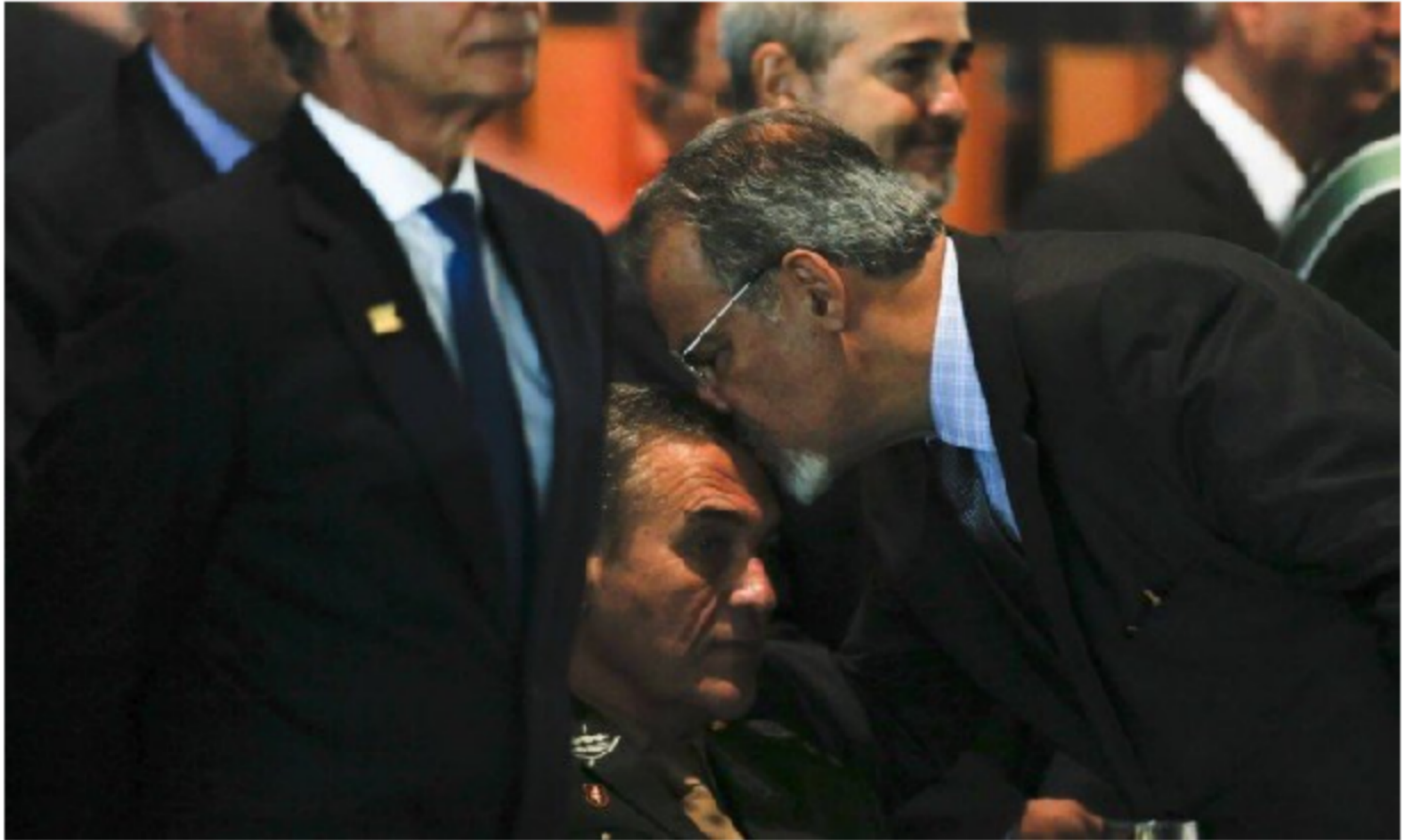
Figura 4: Ministro da Defesa reverenciando o General