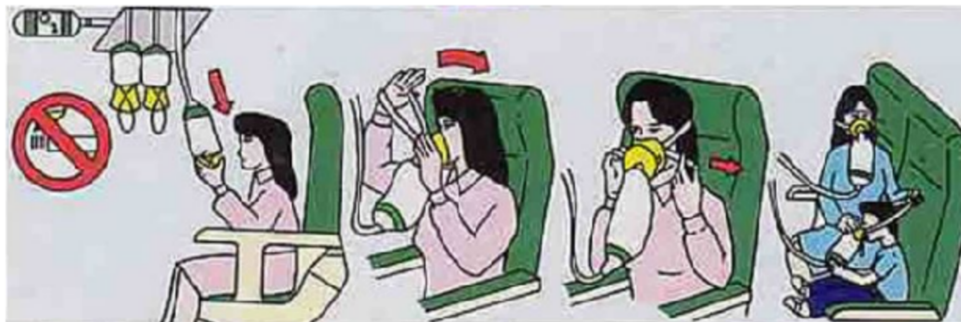
Figura 9: Afresco egípcio sobre segurança aérea, séc. XX D.C.

O fundamento da solidariedade é a tensão dinâmica entre egoísmo (cuidar de si, receber cuidados) e altruísmo (cuidar de outrem, aceitar os cuidados de outrem). A isto chamaremos de ajuda mútua .