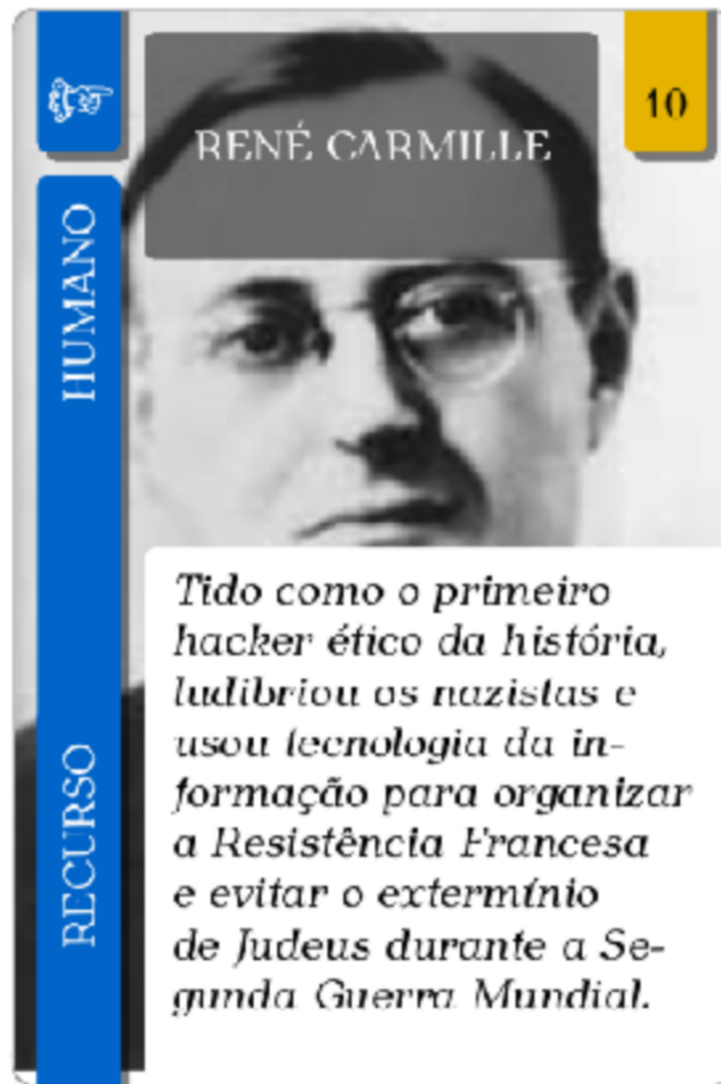
Figura 11: Agente secreto da Rede Marco Polo