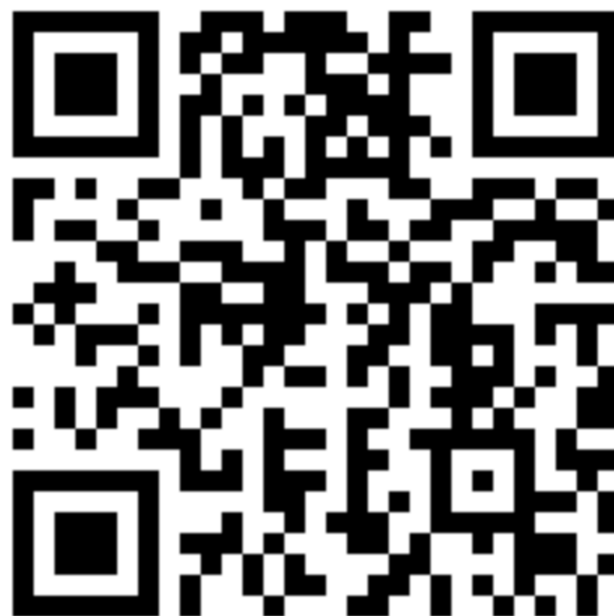
Figura 13: https://opsec.fluxo.info/specs/cryptosindicato.html