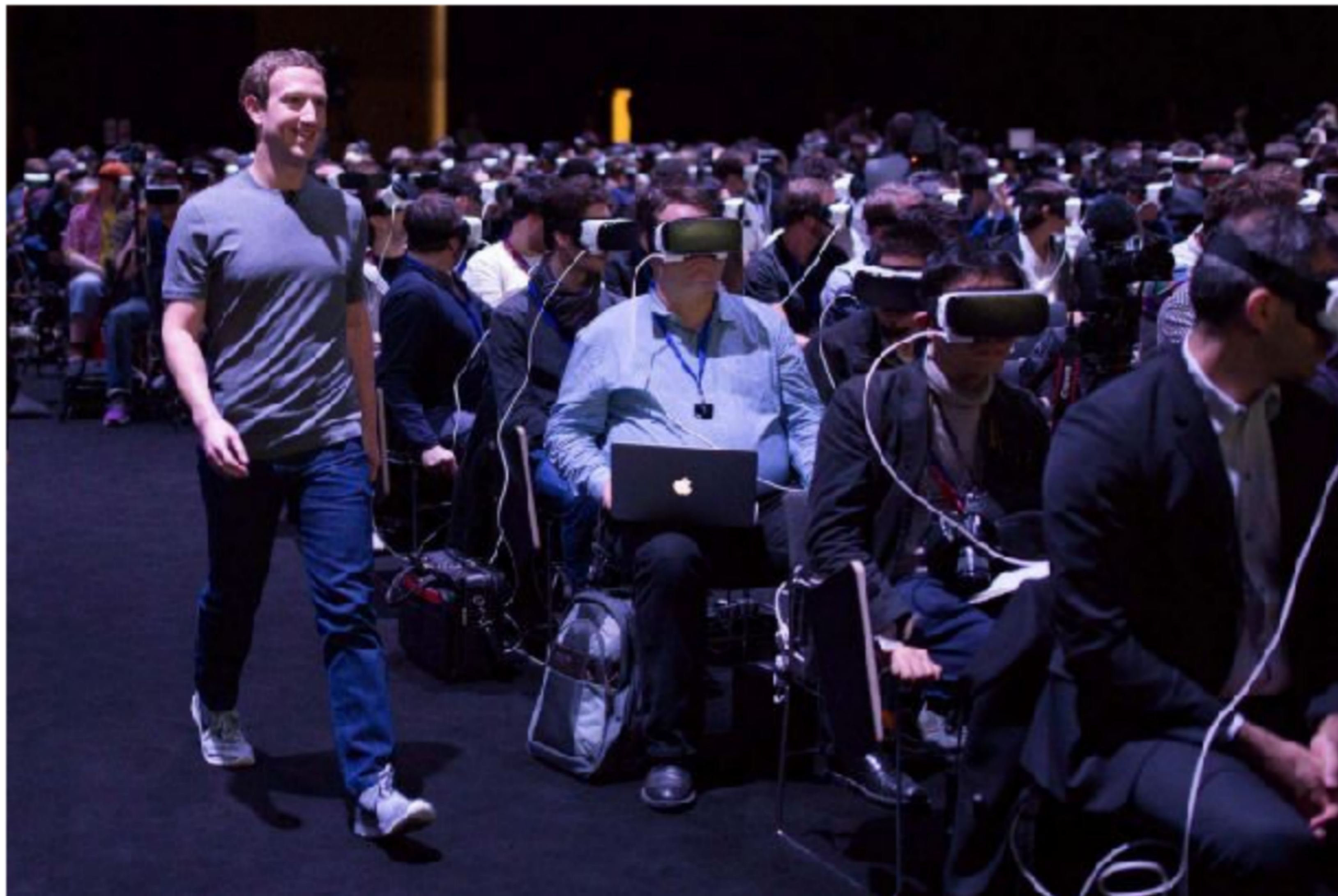
Figura 8: Zombie Nation