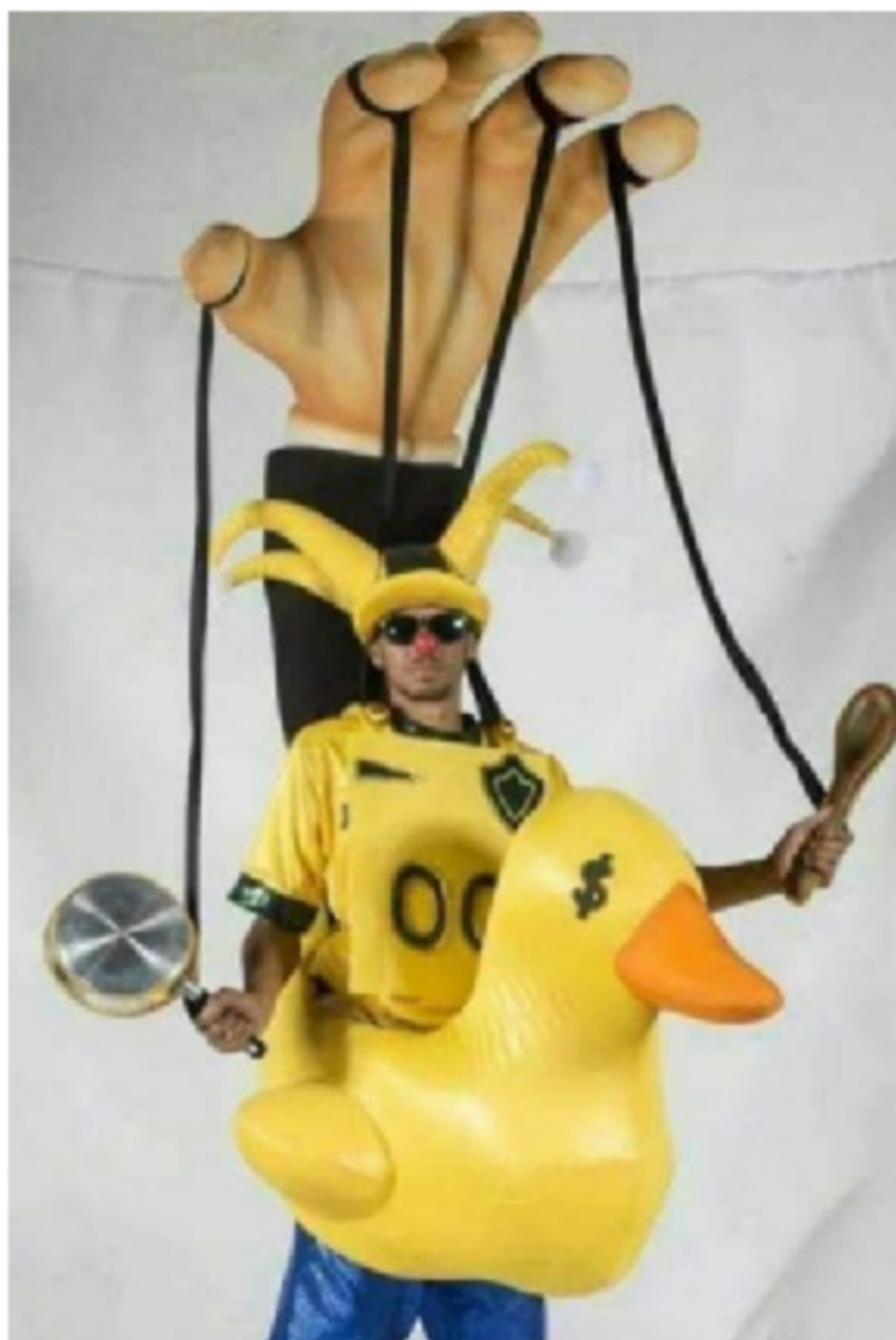
Figura 7: Kit Palhacitos